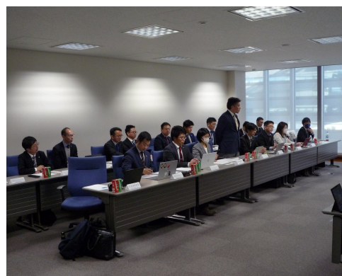
日本税理士会連合会との懇談会