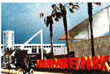
木更津 三井アウトレットパーク