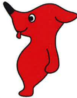
千葉県PRマスコットキャラクター 「チーバくん」

千葉県に住む不思議ないきもの。 好奇心旺盛でいろいろなことに挑戦 するのが大好き。 未知のものに立ち向かうときほど勇 気と情熱がわき、からだも赤く輝く。 食いしん坊でいたずら好きな面も。