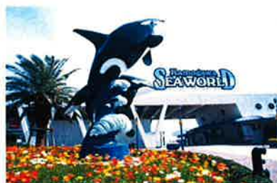
鴨川シーワールド