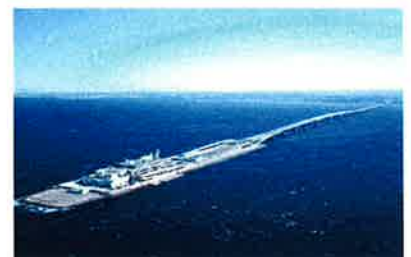
東京湾アクアライン 海ほたる