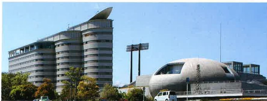
懇親会: 岐阜都ホテル